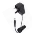
Adaptador de energia