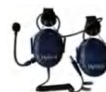
Kit de fone de ouvido com cancelamento de ruído para serviço pesado da Hamlet Intrinsecamente seguro